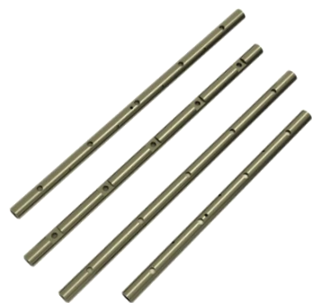
ロッカーアームシャフト