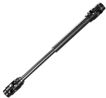
ステアリングシャフト