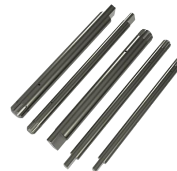
オイルポンプシャフト